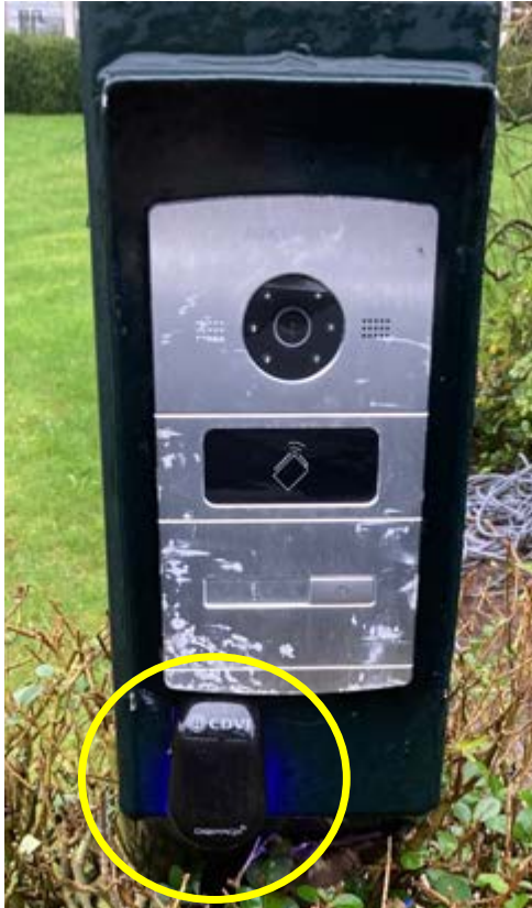
Afbeelding 2: Keytag lezer ingang

De lezer zal een groen lichtsignaal en geluidsignaal geven waarna het hek zal openen. Gaarne wachten tot het hek geheel geopend is en tot stilstand is gekomen.