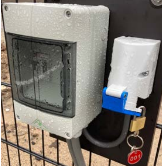
Afbeelding 4: Stroomaansluiting

ontvangt u de afrekening van de daadwerkelijk gebruikte aantal kWh op uw factuur.