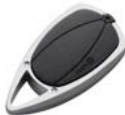
Afbeelding 1: Keytag

U kunt uw voertuig gedurende openingstijden zonder afspraak ophalen en wegbrengen. Om toegang te krijgen tot de stalling dient u wel zelf uw keytag (zie afbeelding hieronder) mee te nemen. Laat deze niet achter in uw voertuig om te voorkomen dat u voor een gesloten hek staat bij het ophalen/wegbrengen. De keytag (zie afbeelding 1) werkt niet op kenteken maar is gekoppeld aan uw vak nummer en klantgegevens waardoor doorgeven van kentekens niet nodig is.