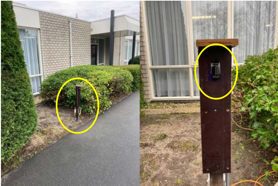
Afbeelding 5: Keytag lezer uitgang

Wij gaan ervan uit dat u een zeer prettige ervaring zult hebben bij onze stalling. Mocht u desondanks suggesties of vragen hebben dan vernemen we dat uiteraard graag.